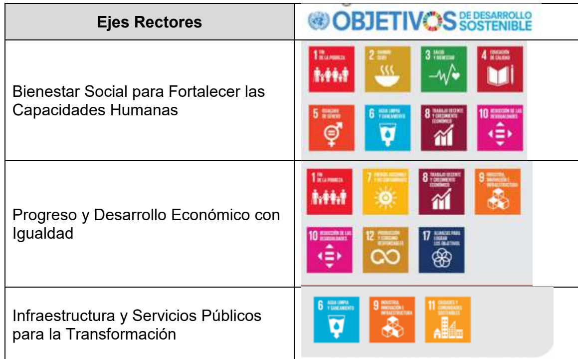
Tabla 6. Alineación de los Ejes Rectores con los Objetivos del Desarrollo Sostenible